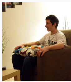
Mentális fejlesztés Coaching