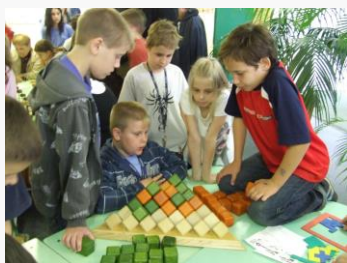
Készség és képesség- fejlesztés játékokkal

A Játszva Tanulj Tehetségprogram négy részből áll: